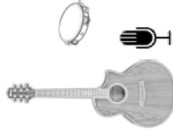
Lionel Chant lead, guitare, Tambourin pied