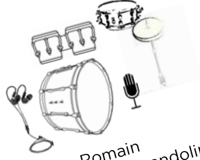
Romain batterie, chant, mandoline (+ un retour casque filaire pour envoi loop violon et guitare)