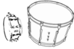
Kick 2+SN 2 dégagement