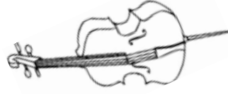
Antoine contrebasse, chant